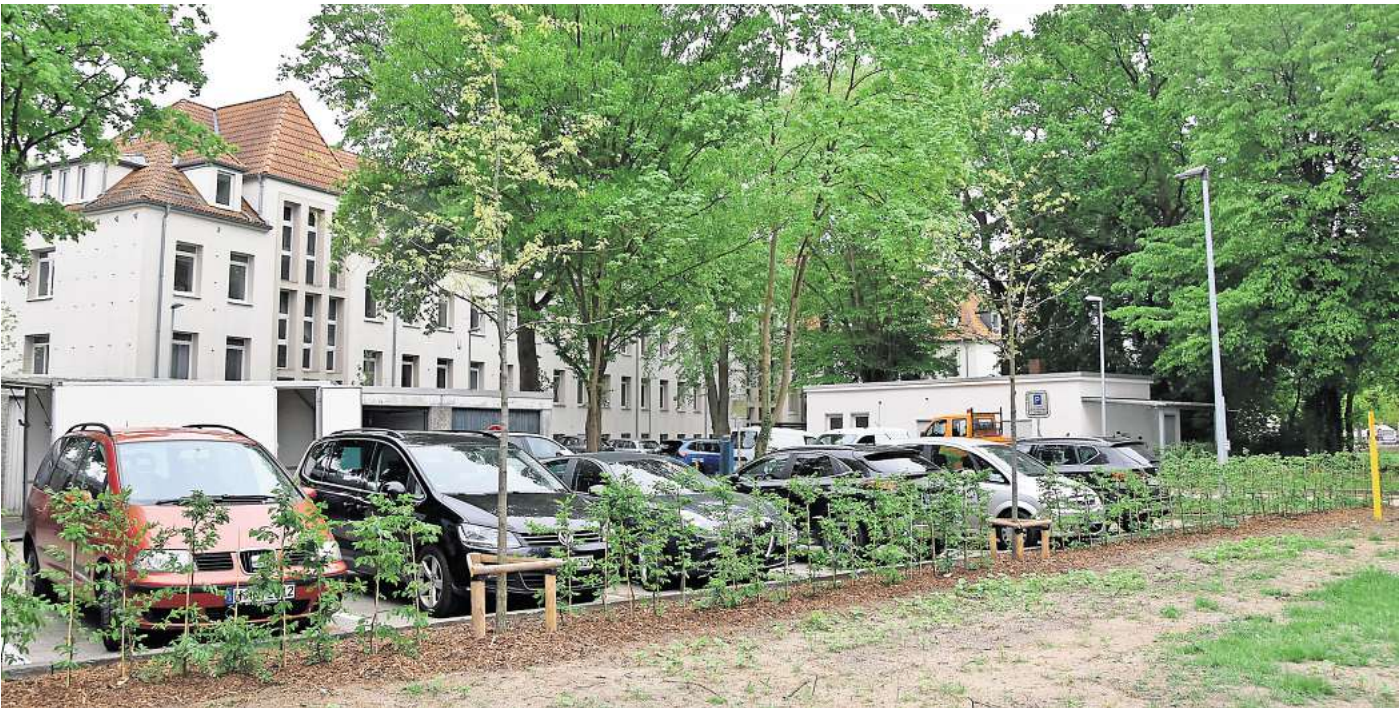
Für rund eine halbe Million Euro: Die Stadt Burgwedel kauft ein Grundstück samt Garagenhof und Fahrradgebäude hinter dem Rathaus.

GROßBURGWEDEL (wal). Es ist noch nicht der ganz große Schlag, aber es könnte ein Vorgeschmack sein: Die Stadt Burgwedel will Teile des Krankenhausgeländes in der Ortsmitte von Großburgwedel erwerben. Der Kaufpreis liegt bei mehr als einer halben Million Euro. Und: Wenn das Klinikum Region Hannover (KRH) in einigen Jahren auf das neue Grundstück an der Ortsumgehung umzieht, könnte die Stadt das gesamte bisherige KRH-Areal direkt neben dem Rathaus übernehmen. Sie erhielte dann den Zugriff auf ein riesiges „Filetstück“ für die weitere Stadtentwicklung. Über sensible Themen wie Vertrags-, Personal- oder auch Grundstücksangelegenheiten berät die Politik im Normalfall hinter verschlossenen Türen. Insofern ist die Beschlussdrucksache, die die Region Hannover nun veröffentlicht hat, eher ungewöhnlich: Wenn der Gesundheitsausschuss am Dienstag, 6. Mai, zu seiner Sitzung zusammenkommt, steht auch der Verkauf eines Grundstücks des KRH an die Stadt Burgwedel auf der Tagesordnung. Der KRH-Aufsichtsrat hat darüber bereits beraten, er empfiehlt den Verkauf. Die Regionspolitik befasst sich jetzt mit dem Thema, da Grundstücksgeschäfte über 500.000 Euro Sache der KRH-Gesellschafterversammlung sind – und dafür braucht es eine Weisung an die Vertreter der Region Hannover in diesem Gremium. Konkret erwartet die Region für den Verkauf einen Erlös von 523.129 Euro. Für diese Summe will die Stadt Burgwedel hinter