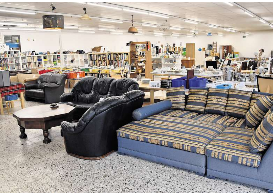
Möbel und mehr für den schmalen Geldbeutel: Die Fairkauf-Mitarbeiter bieten Gebrauchtes günstig an.

2016 hatte die Fairkauf-Center gemeinnützige GmbH in Großburgwedel ihre erste und bis heute einzige Filiale außerhalb des Landkreises Celle eröffnet. Das Integrationsunternehmen hat es sich zum Ziel gesetzt, durch die Ausbildung und dauerhafte Beschäftigung schwerbehinderter Menschen einer Ausgrenzung entgegenzuwirken. „Dabei möchte die Fairkauf-Center GmbH die Fähigkeiten der schwerbehinderten Menschen nutzen und durch den gemeinsamen wirtschaftlichen Erfolg aller Mitarbeiter zur