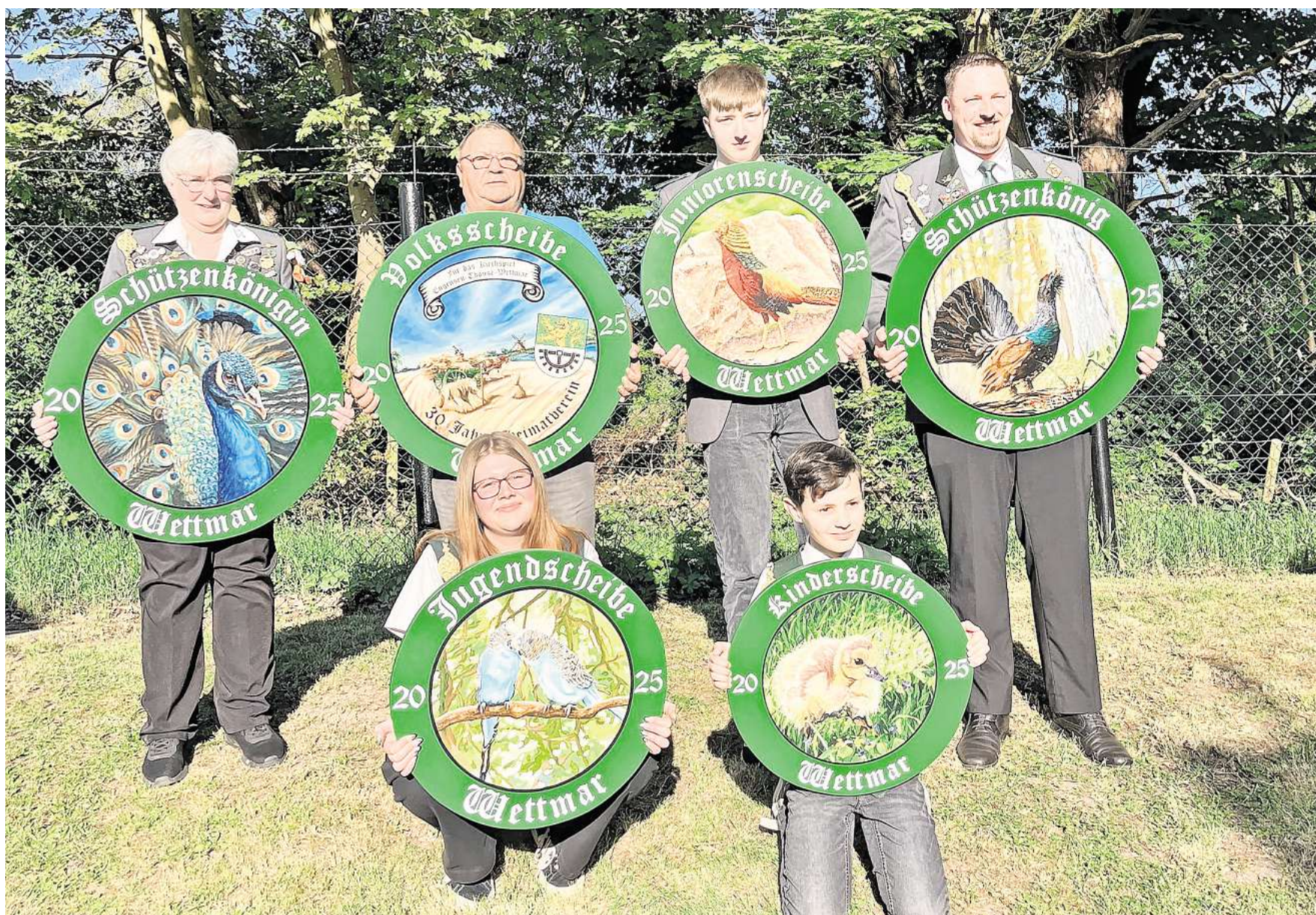
Mit der Proklamation der neuen Majestäten 2025 gehen die Vorbereitungen für das Volks- und Schützenfest in Wettmar auf die Zielgerade.

„GUT ZIEL“ FEIERT VON FREITAG, 23. MAI, BIS SONNTAG, 25. MAI, AUF DEM FESTPLATZ IN WETTMAR