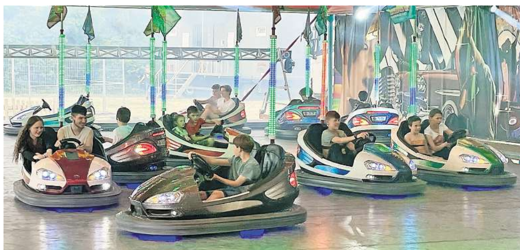
Der beliebte Autoskooter gehört zu jedem Schützenfest dazu.

durch die Ortschaft aufbrechen. Zum festlichen Ausklang lädt ab 15 Uhr eine Kaffeetafel im Festzelt ein, begleitet von den schwungvollen Darbietungen der Musikkapellen.