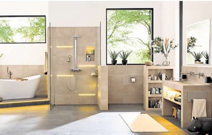
Von der Lichtleiste bis zur beleuchteten Nische können Bauherren mit den LED-Modulen Räume kreativ mit Licht und Keramik gestalten.

chen eine besonders homogene Lichtabstrahlung in verschiedenen Ausprägungen von Warmweiß (3.000 Kelvin) über Neutralweiß (4.900 Kelvin) bis hin zu einer Auswahl von mehr als 16 Mio. Farben. Die Steuerung der Module ist genauso einfach wie vielfältig. Sie können über klassische Lichtschalter bedient werden, wahlweise steht auch eine Funkfernbedienung zur Verfügung. Besonders komfortabel wird es per Smartphone oder Tablet: Dazu wird lediglich ein Receiver installiert, der via Bluetooth mit einer kostenlosen Color-Control-App verbunden wird. (HLC)