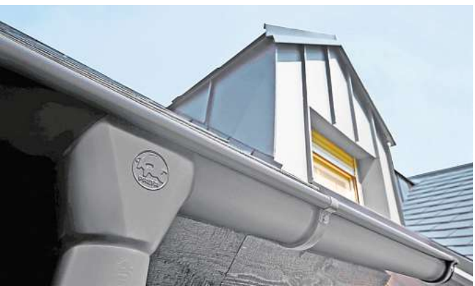
Dachentwässerungssysteme sind robust und langlebig – und überzeugen auch optisch auf ganzer Linie.

In Zeiten extremer Trockenheit wird Regen sehnlichst erwartet. Doch ist er erst einmal da, kann der Niederschlag auch schnell zu viel des Guten werden. Damit die eigenen vier Wände auch bei (Stark-)Regen optimal geschützt sind, ist eine zuverlässige und fachgerecht montierte Dachentwässerung unerlässlich – sonst kann Feuchtigkeit ins Mauerwerk eindringen und die Bausubstanz schädigen. Dafür gibt es nicht nur Aluminiumdächer und -fassaden, sondern auch Dachrinnen und Fallrohre aus Alu-