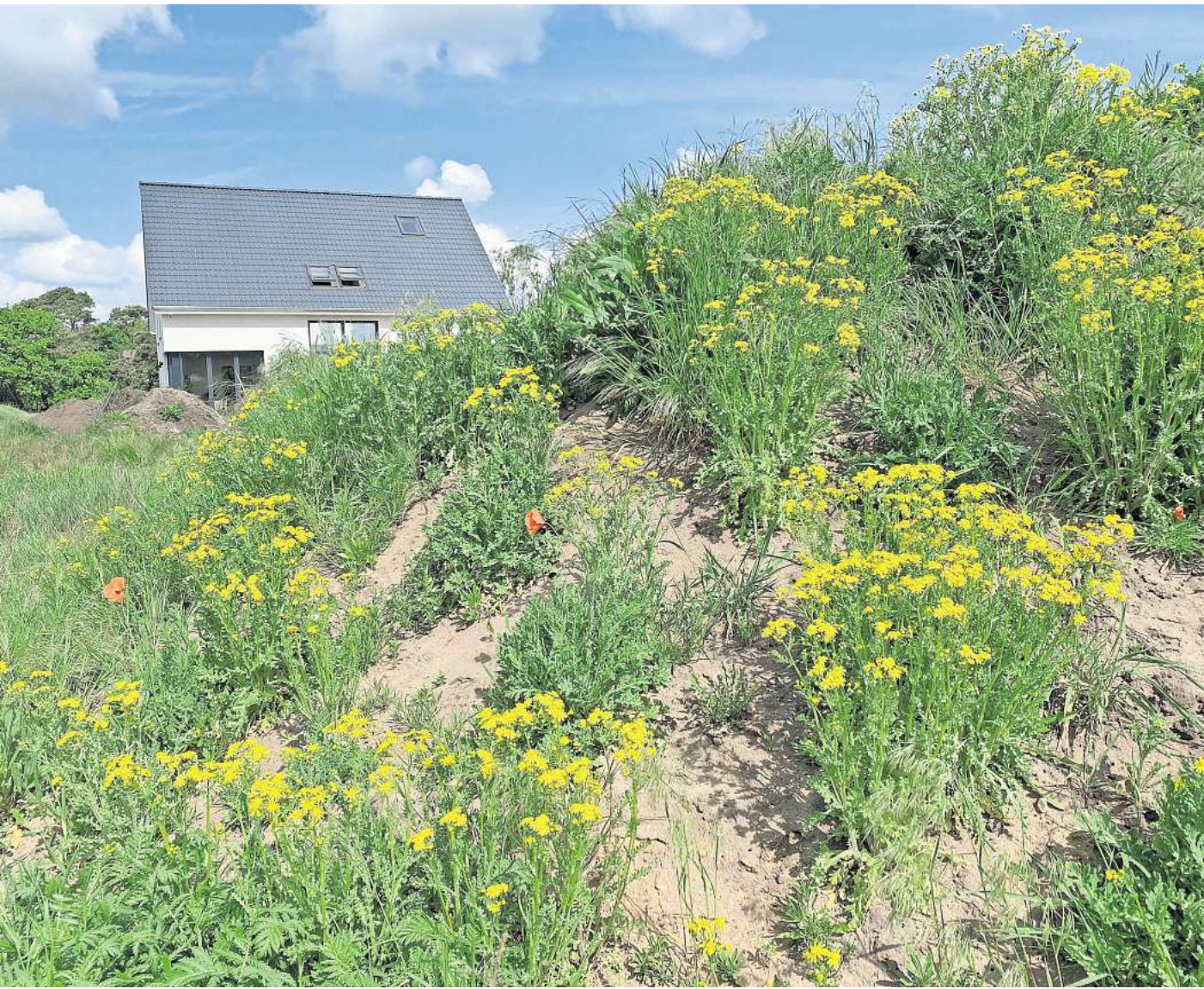
Mutterbodenhügel: Auch im Engenser Neubaugebiet am Saatkamp wächst das Jakobskreuzkraut.

Das Problem mit der Pflanze: Sie enthält in allen Pflanzenteilen giftige Pyrrolizidinalkaloide, die den Leberstoffwechsel der Tiere angreifen. Die stärkste Konzentration befindet sich in den Blüten selbst, informiert die Niedersächsische Landwirtschaftskammer. Pferde seien besonders empfindlich für dieses Gift, gefolgt von Wiederkäuern wie Rindern. Schafe und Ziegen wiederum seien weniger betroffen. In frischem Zustand meiden die Tiere auf der Weide die giftige Pflanze meist, da sie bitter