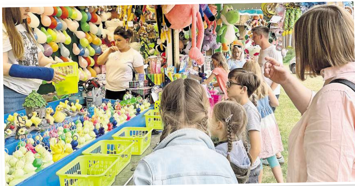
Für abwechslungsreiche Unterhaltung wird auf dem Festplatz gesorgt sein.

An diesem Abend überreichen die noch amtierenden Könige von 2024 ihre Königsketten an die neuen Würdenträger. Im Anschluss erwartet alle Gäste ein festliches Kommersbüfett. Essensmarken sind noch bis zum 20. Mai im Schützenhaus sowie im Kiosk „Unter den Eichen“ zum Preis von 25 Euro pro Person erhältlich. Kinder im Alter von 6 bis 12 Jahre zahlen 15 Euro, Kinder unter 6 können kostenlos essen.