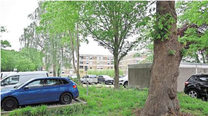
Dicht beieinander: Zwischen Rathaus und Krankenhaus in Großburgwedel liegen nur rund 100 Meter.

Während auf der 3300 Quadratmeter großen Fläche also zumindest vorerst keine Veränderungen zu erwarten sind, wird sich die Nutzung des restlichen KRH-Areals nach dem Krankenhausumzug grundlegend ändern. Das geschätzt 40.000 Quadratmeter große Grundstück böte beispielsweise Platz für Hunderte von Wohnungen – und das in absolut zentraler Lage. „Das wird aber ja erst in etlichen Jahren Thema“, bremsen Götze konkrete Nachfragen. Klar ist aber: „Das Interesse der Stadt am Krankenhausgrundstück ist hinterlegt.“