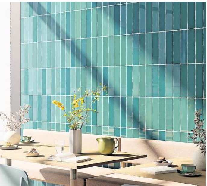
Spanische Keramikfliesen sind in einer Fülle attraktiver Grüntöne erhältlich und stillen unsere Sehnsucht nach mehr Natur und Nachhaltigkeit.

Jede Farbe hat eine andere Wirkung. Grün zum Beispiel steht für Natürlichkeit und Harmonie, der Trendton ist beruhigend und ausgleichend. Kein Wunder also, dass Grün in allen Nuancen auch in den eigenen vier Wänden sehr beliebt ist. Ob Hell- oder Dunkelgrün, Jade- oder Smaragdgrün, Apfel- oder Kiwi-grün: Die Farbvariationen sind nahezu unendlich. Auch spanische Keramikfliesen sind in einer Fülle attraktiver Grüntöne erhältlich und stillen unsere Sehnsucht nach mehr Natur und Nachhaltigkeit – schließlich gibt es kaum ein ursprünglicheres Material als Keramik. Die Fliesen werden aus Ton und Wasser gebrannt, sind langlebig und pflegeleicht und können zu einem großen Teil recycelt und so in den Stoffkreislauf zurückgeführt werden. Keramische Fliesen sind außerdem