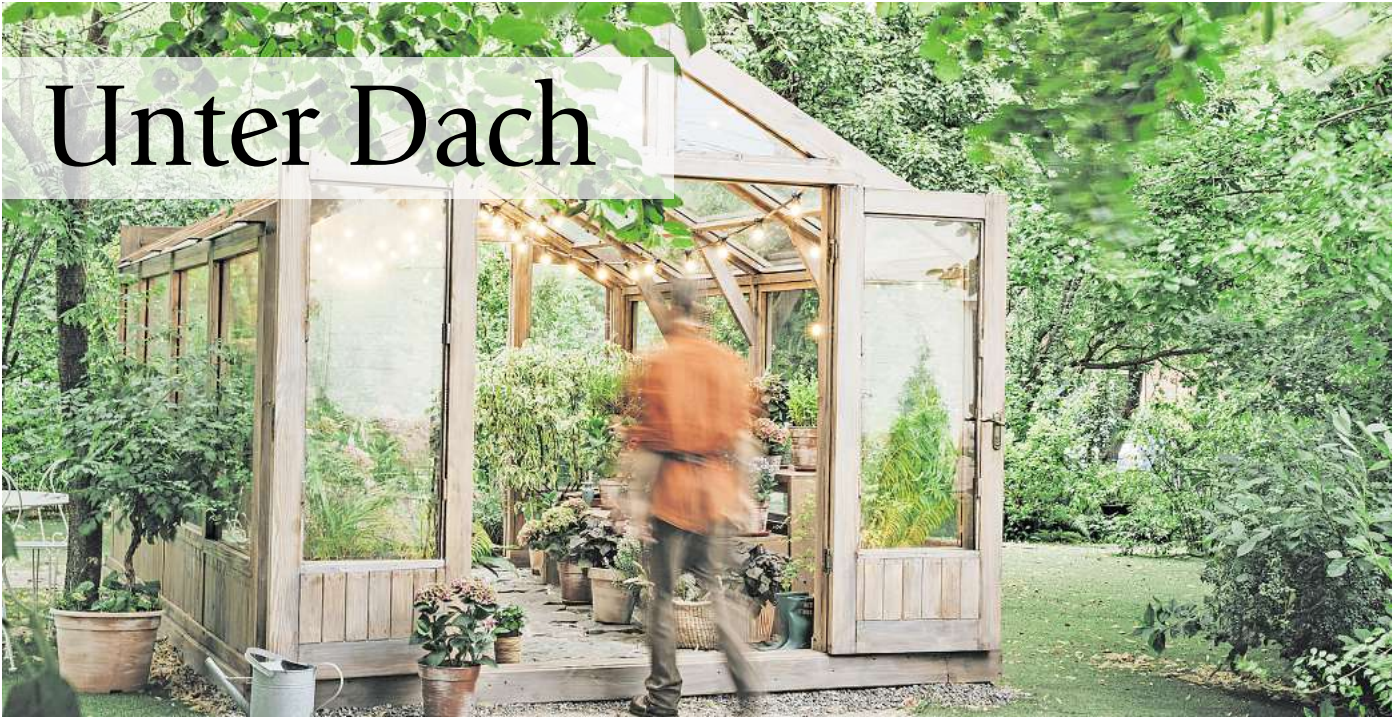
Glashäuser brauchen einen soliden Unterbau.

Anzeigenschluss für die nächste Ausgabe: Donnerstag, 12.00 Uhr