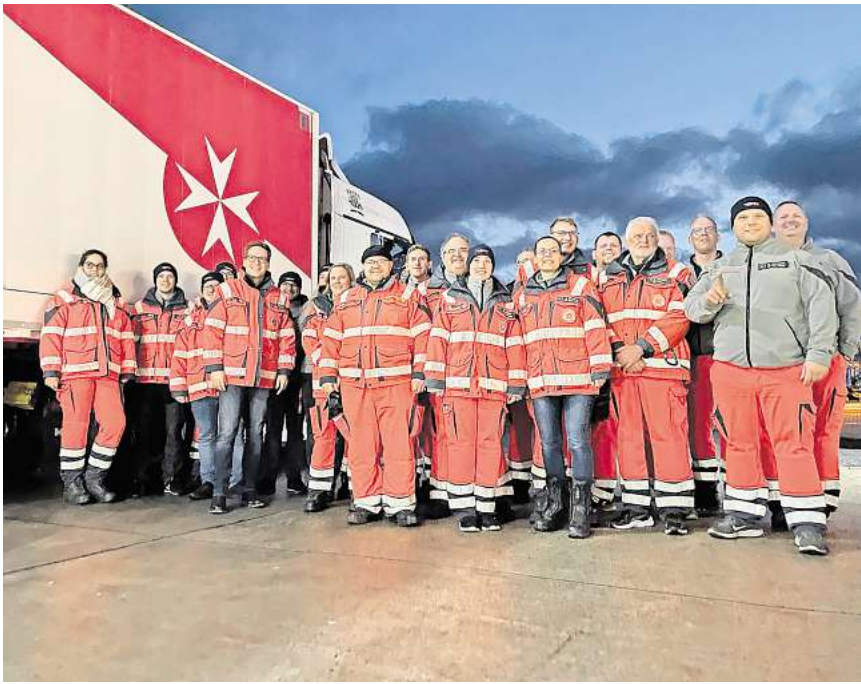
Die Johanniter-Weihnachtstrucker bringen auch in diesem Jahr Geschenke zu Bedürftigen.