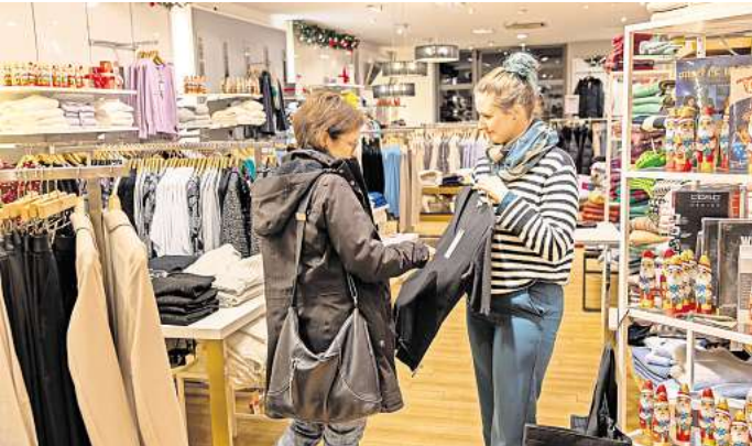
Einige Geschäfte laden zum Late Night Shopping ein.