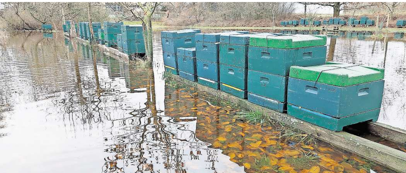
See statt Wiese: Der Starkregen zu Weihnachten 2023 hatte auch in Burgwedel Spuren hinterlassen.

Betrachtet man Burgwedel, so fällt sofort auf, dass besonders Engensen stark von Hochwasser betroffen sein könnte. Der Ortskern um die Schillerslager Straße und das Gebiet zwischen Alter Postweg und Grashofsweg weisen zahlreiche dunkelblaue Flecken auf. Diese bedeuten, dass bei