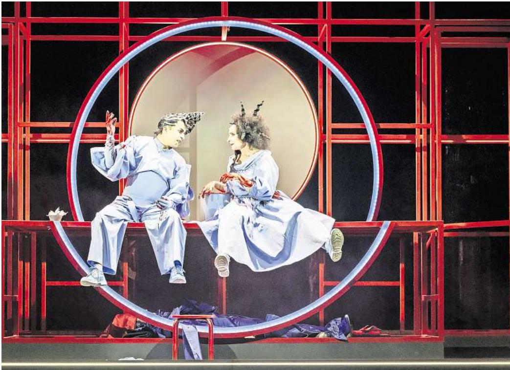
Am 17. Januar steht der Musical-Thriller „Sweeney Todd“ auf dem Programm.

Als Geschenkidee bieten der Verkehrs- und Verschönerungsverein (VVV) und die Stadt Burgdorf wieder ein Weihnachts-Wahlabonnement für das Theater am Berliner Ring an. Es ermöglicht den Besuch von zwei Vorstellungen in der zweiten Hälfte der Spielzeit 24/25. Folgende Gaststücke des Theaters für Niedersachsen (TfN) stehen zur Auswahl: „Sweeney Todd“ (Musical-Thriller, 17. Januar), „Don Quixote“ (Schauspiel, 14. Februar), „Unendliche Sterne“ (Musikalischer Abend, 28. März), „Im Menschen muss alles herrlich sein“ (Schauspiel, 25. April) sowie „Und täglich grüßt das Murmeltier“ (Musical, 23. Mai). Die Aufführungen beginnen jeweils freitags um 20 Uhr. Eine halbe Stunde vorher sind die Zuschauer zu einer kostenlosen Einführung eingeladen. Erhältlich ist das Weihnachts-Wahl-Abo bei Bleich Drucken und Stempeln, Braunschweiger Straße 2, Telefon (05136) 1862.