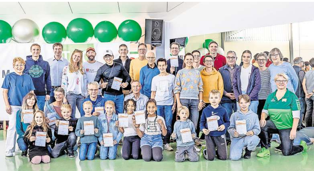
Vergabe der Sportabzeichen bei der Turnerschaft.

Zum Hintergrund informiert die Turnerschaft: Bereits seit mehr als 50 Jahren ist die Teilnahme für Jeden, der Zeit und Lust hat, möglich. Auch ohne sportliche Vorkenntnisse können Teilnehmer mit oder ohne