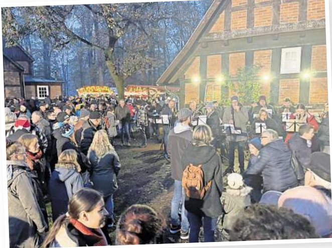
Advents- und Weihnachtslieder werden für festliche Stimmung auf dem Fuhrberger Weihnachtsmarkt sorgen.

KFZ-MEISTERBETRIEB ANDREAS WITTE KFZ-MEISTER