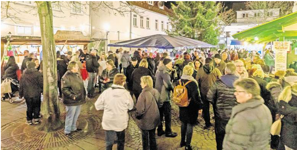
Der Förderverein der St.-Pankratius-Gemeinde veranstaltet wieder den traditionellen Weihnachtsmarkt auf dem Spittaplatz.

Außerdem gibt es Pizza und Flammkuchen, Fischbrötchen, Crêpes, Süßwaren, Langos und vieles mehr. Darüber hinaus verkauft der Elternrat des Vereins Lebenshilfe wieder Marmeladen, Basteleien und Schlüsselanhänger und das Team vom JohnnyB. und dem Verein Kultürchen bietet Mitmachaktionen für Kinder an. Wer sich zwischendurch aufwärmen möchte, kann die Kaffeestube im Spittasaal besuchen, die vom Förderverein der Kita am Fröbelweg betrieben wird. Zusätzlich lädt eine Weihnachtsausstellung im Burgdorfer Schloss zum Besuch ein. Dort gibt es unter anderem Kunsthandwerk, Geschenkkarte, Weihnachtskarten und Honig von einem ortsansässigen Imker.