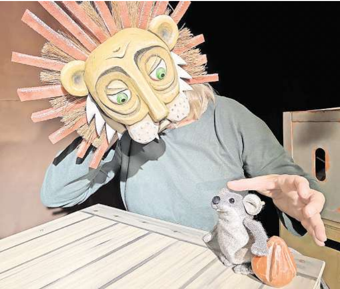
Die Jugendpflege lädt zum Kindertheater „Mutig wie ein Löwe“, gespielt vom Theater Marmelock, ein.

Das Stück ist geeignet für Kinder ab 4 Jahre, die Altersbegrenzung ist zu beachten. Der Eintritt für große und kleine Menschen beträgt 5 Euro.