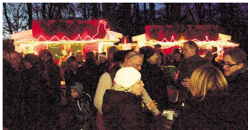
Stimmungsvoller Budenzauber rund um das Fuhrberger Gemeindehaus.

Außerdem können Besucher sich von kleinen Geschenkkästen inspirieren lassen – darunter Fotokarten, Töpferwaren und Bienenprodukte.