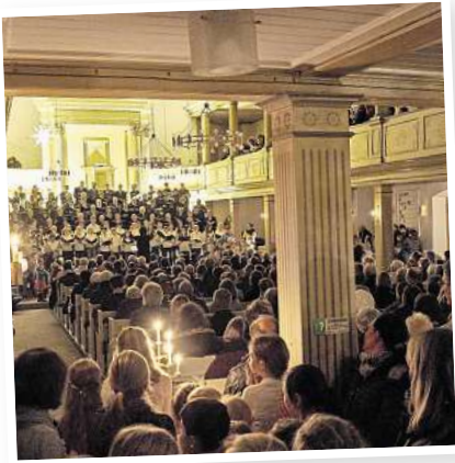
Zum Quempassingen ist die St.-Pankratius-Kirche in der Regel gut gefüllt.

15.00 Uhr Akkordeonorchester Hohner-Ring 16.30 Uhr Shantychor Graf Luckner 18.00 Uhr Feuerwehrmusikzug Burgdorf-Hänigsen