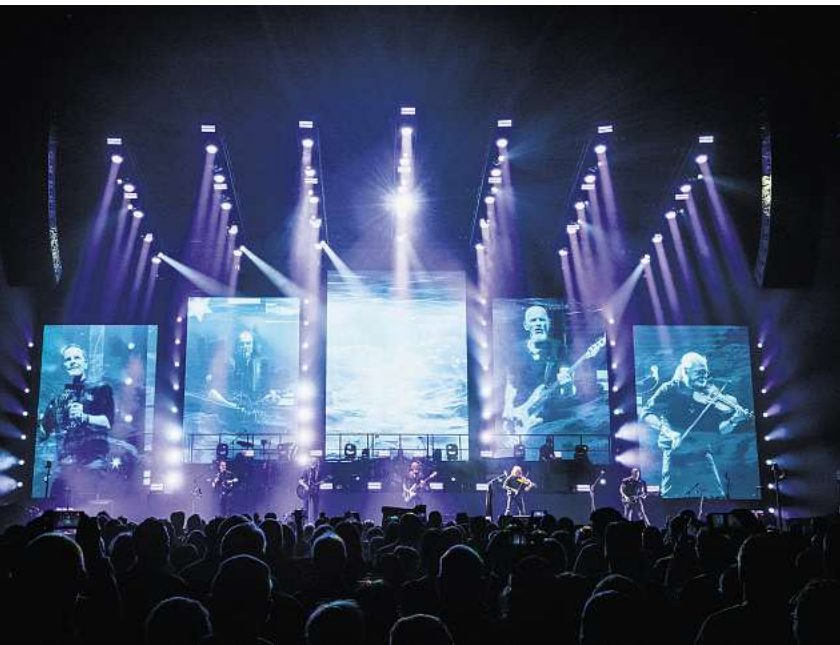
Die Rockband Santiano kommt nach Burgdorf.

werden niemals untergehen“, „Durch jeden Sturm“, „Wenn die Kälte kommt“ sowie „Angekommen“, „Am Ende des Tages“ oder „Es klingt nach Freiheit“. Die Songtexte überzeugen vor allem durch lebendige wie berührende Geschichten. Karten für Stehplätze kosten 61 Euro, Sitzplätze gibt es für 81 Euro. Kinder erhalten Ermäßigungen. Einen Rundum-Konzert-Genuss bietet das VIP-Ticket für 199 Euro. Zusätzlich fallen Vorverkaufsgebühren an. Die Tickets sind bei allen bekannten Vorverkaufsstellen erhältlich, unter anderem bei Bleich Drucken und Stempeln (Braunschweiger Straße 2), HAZ/ NP/Marktspiegel-Geschäftsstelle (Marktstraße 16) sowie allen Edeka Cramer Märkten.