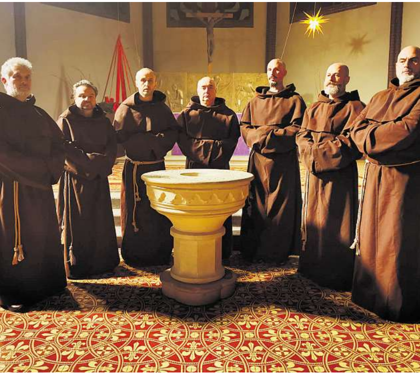
In Mönchskutten gekleidet, stimmen die Sänger Gregorianische Gesänge aus dem Mittelalter und andere geistliche Lieder an.

doxen Kirchenmusik und der Gregorianik des Mittelalters verwurzelt, spannt das Ensemble den Bogen über geistliche Lieder der Renaissance und des Barocks bis hin zu Klassikern der Popmusik wie zum Beispiel „Halleluja“ von Leonard Cohen, „The Sound of Silence“ von Simon & Garfunkel und „Amazing Grace“ von Andrew Lloyd Webber. Stimmungsvolle Weihnachtslieder runden den Konzertabend ab.