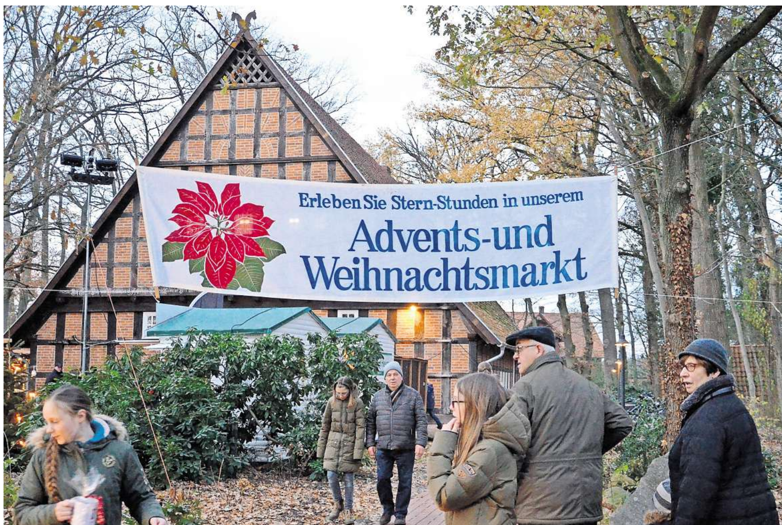
Der Fuhrberger Weihnachtsmarkt öffnet am 30. November von 15 bis 21 Uhr seine Pforten.

Fuhrberger Weihnachtsmarkt erstmals mit Bühne und verlängerter Öffnungszeit