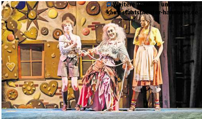
Hänsel und Gretel: Märchenspiel von Engelbert Humperdinck nach dem Märchen der Brüder Grimm.

Uhr im Opernhaus. Am 8. und 16. Dezember finden die beliebten „Sing along“-Vorstellungen statt, bei diesen ist – nach vorherigem Üben im Lavesfoyer eine Stunde vor der Vorstellung – das Mitsingen aus dem Publikum ausdrücklich erwünscht. Karten (25,50 bis 75,50 Euro, ermäßigt ab 6 Euro) sind im Vorverkauf erhältlich.