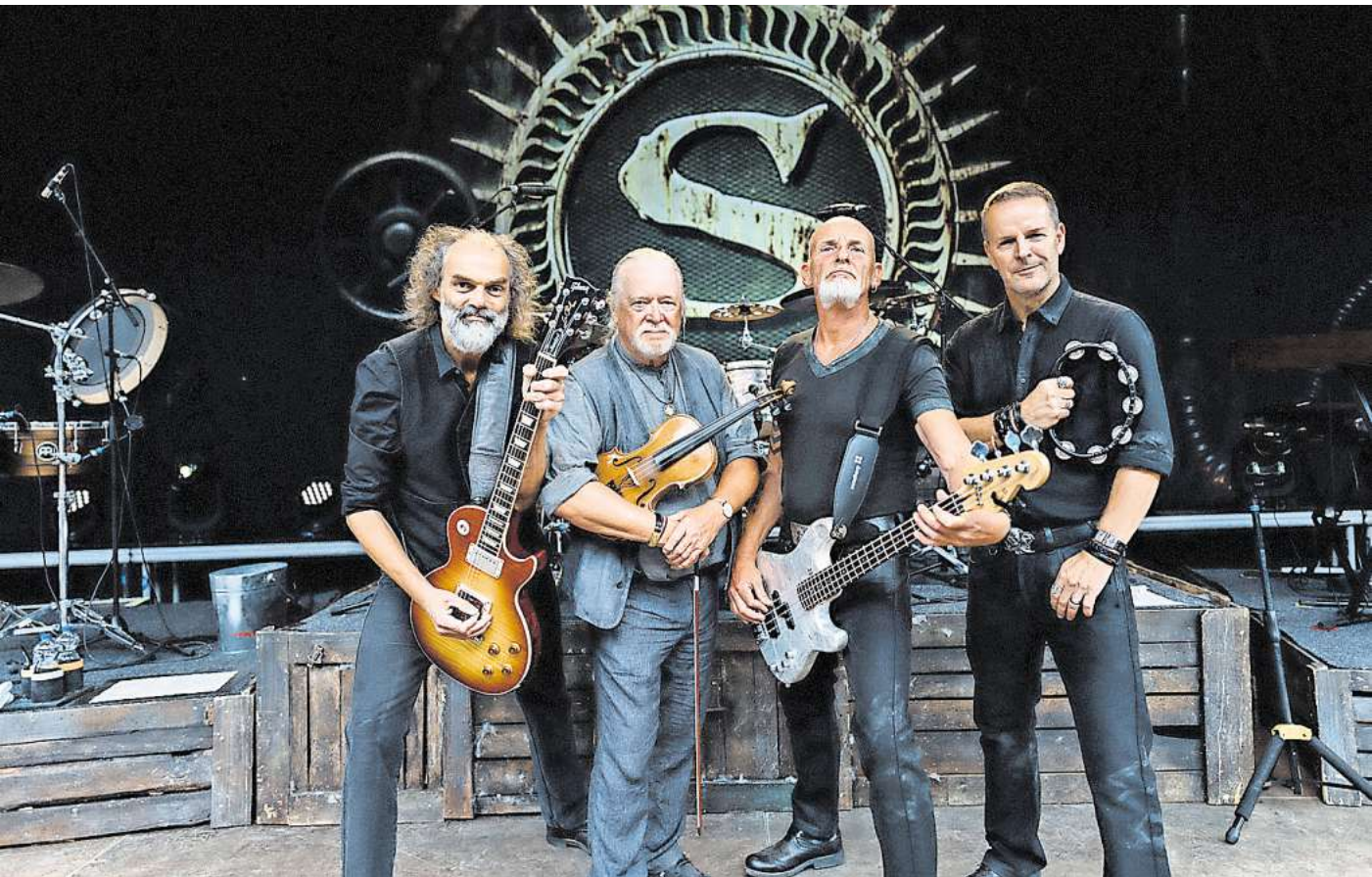
Im Rahmen ihrer „Doggerland! 2025“-Tour gibt die Rockgruppe Santiano am 30. August ein Konzert auf dem Burgdorfer Schützenplatz.

Unterstützt wird das Open Air zudem von den Haupt-