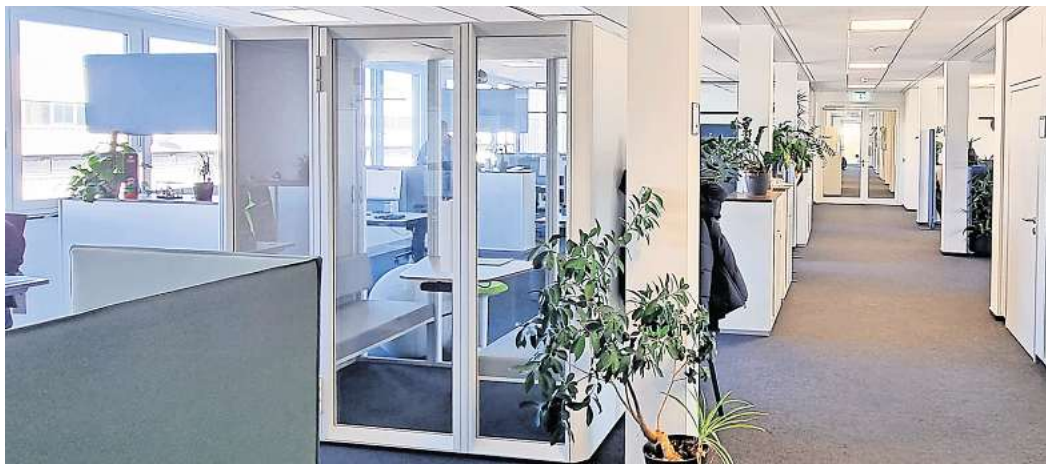
Schreibtische täglich buchen: Bei Agravis setzt man auf mobiles Arbeiten.