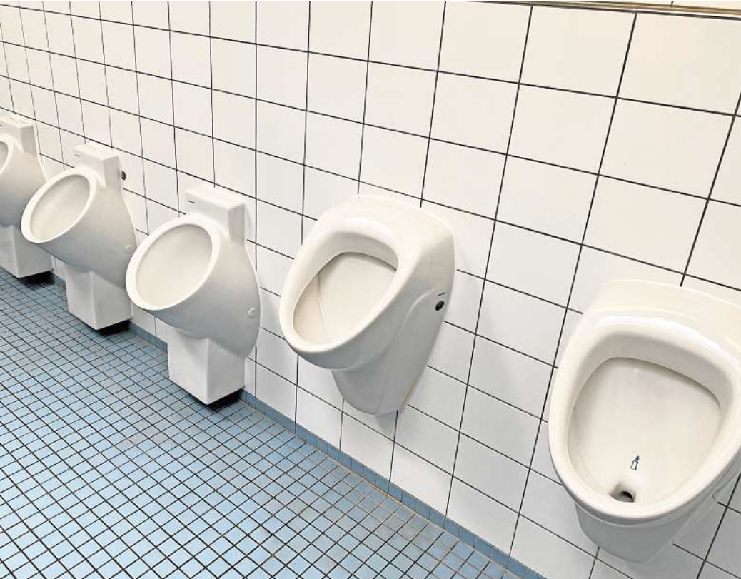
Frischkur: Gemeinde lässt drei neue Urinale aufhängen.

Ein erster Schritt war jetzt die Erneuerung der 27 Jahre alten Heizungsanlage. Die neue 1000 Kilowatt starke Anlage versorgt das Schwimmbad, die Sporthalle, die Feuerwehr, die Grundschule und zwei Mehrfamilienhäuser an der Hannoverschen Straße mit Nahwärme. Im nächsten Schritt soll dann zusätzlich eine Wärmepumpe sowie eine Photovoltaikanlage installiert werden. Das ginge aber erst dann, wenn alle Heizkörper in der Schule erneuert worden seien, erläutert Götze. Die Gemeinde investiere in die Erneuerung der Heizung rund 200.000 Euro, aktuell würden das Lehrer- und Elternzimmer saniert.