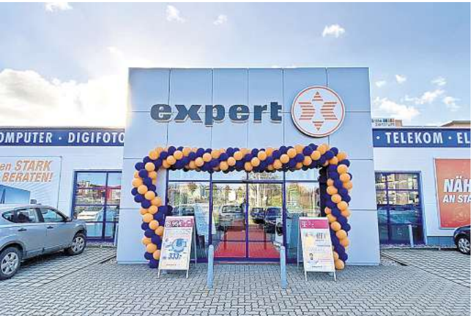
expert erwartet traditionell einen großen Kundenansturm.

Elektrofachmarkt feiert mit vielen Sonderangeboten