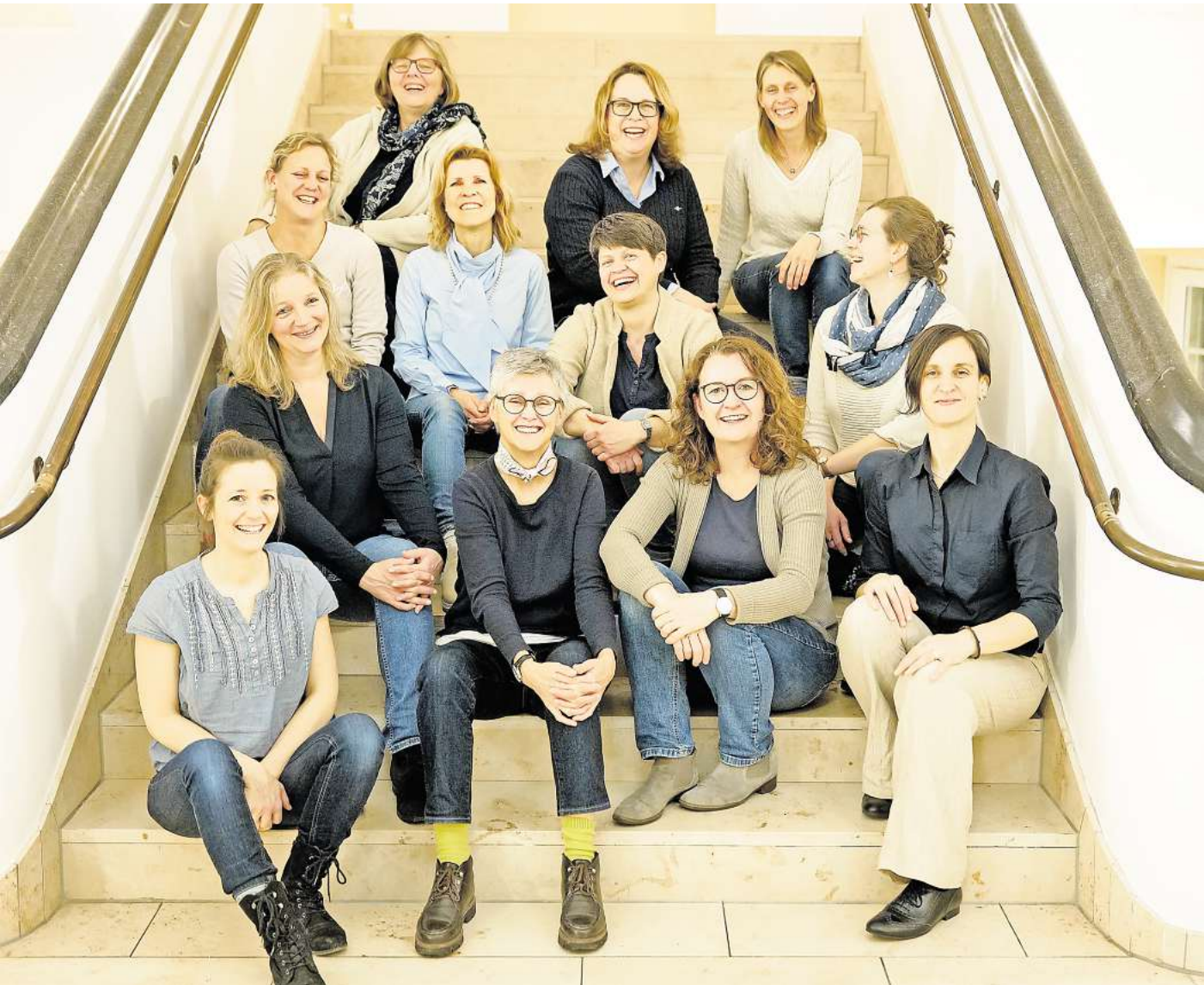
Unter dem Titel „folgenreich“ präsentieren die zwölf Sängerinnen aus Burgdorf, Hannover und Hildesheim am 2. November ein vielfältiges Programm rund um das Thema „Folgen“

Frauen-Vokalensemble präsentiert „folgenreich – zum Mitverfolgen und Nachfolgen“