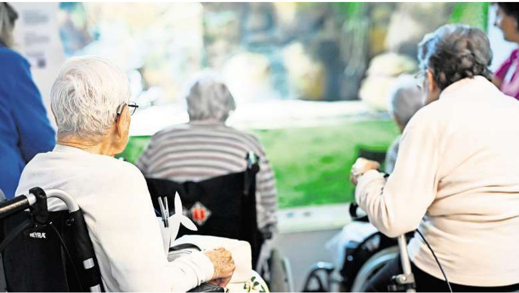
Besuche im Pflegeheim können für Angehörige emotional herausfordernd sein.

Auch wenn es Angehörigen erst einmal schwerfällt: Die eigenen Gefühle anzusprechen, etwa gegenüber dem Pflegepersonal, ist ein Anfang. Im besten Falle haben sie Ideen, was die Besuche angenehmer machen kann - zum Beispiel, wenn man sie mit einer Aktivität im Heim verknüpft. «Dann ist man eben beim Gedächtnistraining dabei, bei der Gymnastik oder dem Konzert», schlägt Pflege-