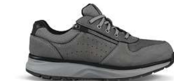
Dynamo ZIP dark grey

L. Kay: Mit der Wahl des richtigen Schuhs sollte sich grundsätzlich jeder auseinandersetzen. Insbesondere jedoch Menschen, die berufsbedingt oder in der Freizeit viel Gehen oder Stehen, bieten Joya Schuhe optimale Entlastung und Prävention von Fehlstellungen, Verletzungen und den damit verbundenen Beschwerden. Auch Ärzte und Therapeuten empfehlen Joya Schuhe bei Rücken- und Gelenkproblemen und setzen sie erfolgreich bei verschiedenen Beschwerden des Bewegungsapparates ein.