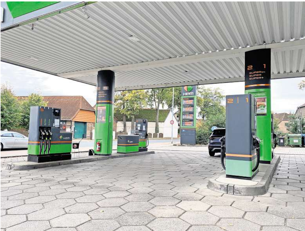
Günstiger: Die HEM Tankstelle in Heebel bietet ihren Kunden ein Cent weniger für Benzin und Diesel.

Ebenfalls an der Ortsdurchfahrt in Fuhrberg liegt die Tankstelle M1, die dem hannoverschen Mineralölunternehmen Mundt gehört. Tankstellenleiter Cord Kausche zufolge wird der