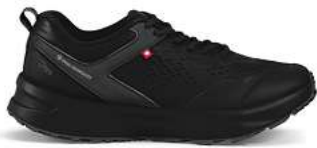
Veloce SR black