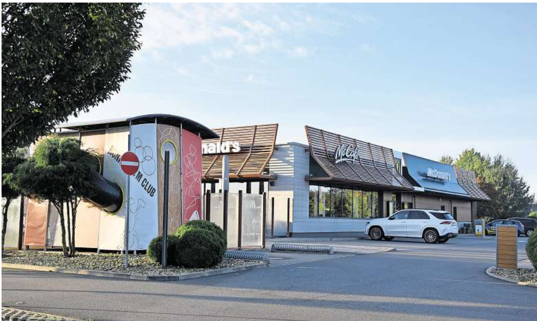
Wird mehrere Wochen lang umgebaut: McDonald's an der Autobahn 7 in Großburgwedel.

Die rund 60 Mitarbeiter am Standort sollen während der Bauphase Schulungen besuchen, Urlaub nehmen und teil-