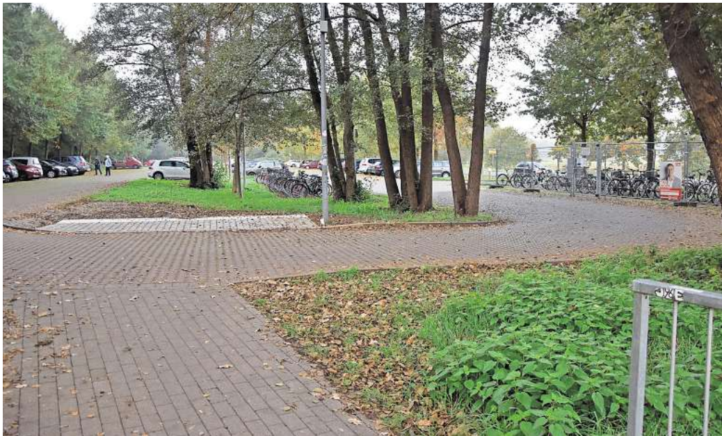
Bleibt während der Sperrung nutzbar: der Pendlerparkplatz mit Fahrradabstellanlage (rechts).

Sperrung wie üblich erreichbar. Sie können auch die Bahnunterführung nutzen. Radfahrer haben so weiterhin die Möglichkeit, ihr Zweirad auf dem Pendlerparkplatz auf der anderen Seite abzustellen. Autofahrer können die Park-and-Ride-Fläche auf der Nordseite des Bahnhofs während der Sperrung zwar weiter erreichen, allerdings nur über die L381 Großburgwedel-Fuhrberg. Wer aus Großburgwedel mit dem Auto kommt, muss also sechs Wochen lang die Bissendorfer Straße nutzen, um den Pendlerparkplatz zu erreichen. Die großflächige Umleitung verläuft vom Bahnhofskreisel an der L 381 über die Wallstraße nach Kleinburgwedel und von dort weiter nach Großburgwedel. Der neue Kreisel direkt vor dem Rathaus ist fertig und freigegeben. Für die Bauarbeiter auf der Fuhrberger Straße geht es dann im mittlerweile vierten Bauabschnitt weiter. Dieser umfasst den Abschnitt von der Rewe-Zufahrt bis zur Einmündung des Sonnenwegs gegenüber dem Krankenhaus.