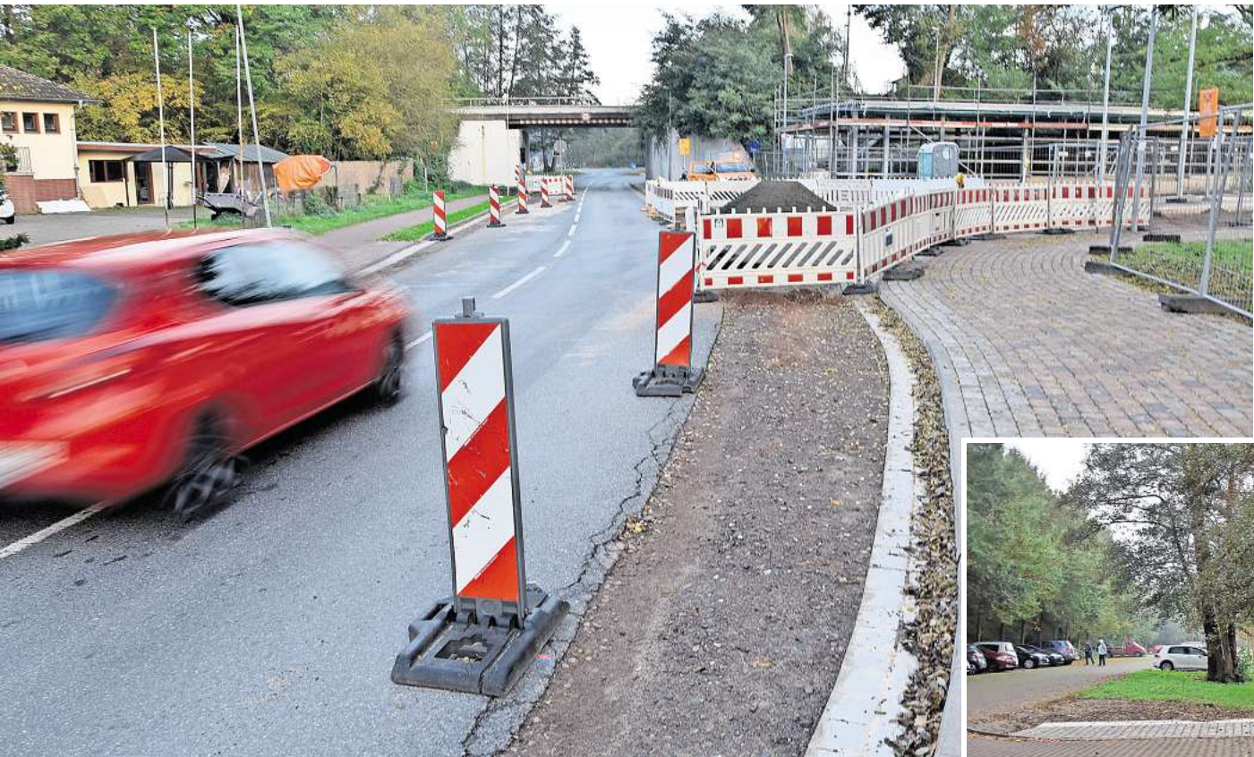
Sechs Wochen lang dicht: die Bahnhofstraße am Bahnhof Großburgwedel.

GROßBURGWEDEL (wal). Seit Februar lässt die Region Hannover den Bahnhofsvorplatz aufwendig umbauen. Autofahrern steht deshalb vor dem Bahnhof seit längerem nur ein Fahrstreifen zur Verfügung, Baustellenampeln regeln den Verkehr. Jetzt erfordert der Baufortschritt, dass die Bahnhofstraße in diesem Bereich für den Autoverkehr voll gesperrt wird. Das direkte Bahnhofsumfeld hat sich mittlerweile stark verändert. Neben dem Aufgang zum Gleis in Richtung Celle ist schon die neue Bike-and-Ride-Anlage zu erkennen. Die Fundament- und Betonarbeiten sind abgeschlossen, auch die Stahlrahmen stehen. Nun folgen dort Holz- und Dachdeckerarbeiten sowie der Innenausbau. Für die Buswendeanlage und die dazugehörigen Aufstellflächen sind die Betonarbeiten im Gange, als Nächstes wird die Zufahrt asphaltiert. Insgesamt investiert die Region Hannover rund 4 Millionen Euro in den Umbau des Bahnhofs in eine sogenannte Mobilstation. Unterstützt wird sie dabei durch das Bundes-Förderprogramm „Modellprojekte zur Stärkung des ÖPNV“. Fußgänger und Radfahrer können passieren. Jetzt wird es nötig, die L381 direkt vor dem Bahnhof für den Autoverkehr zu sperren.