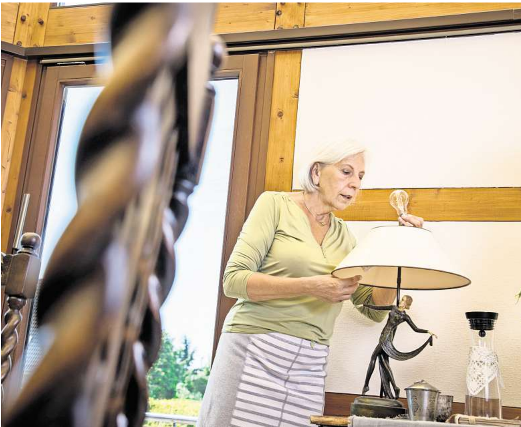
Gute Beleuchtung hilft: Helle, blendfreie Lichtquellen können Stolperstellen im Alter sicherer machen.

Dem Zentralverband der Deutschen Elektro- und Informations-technischen Handwerke (ZVEH) zufolge können zu einem altersgerechten Beleuchtungskonzept