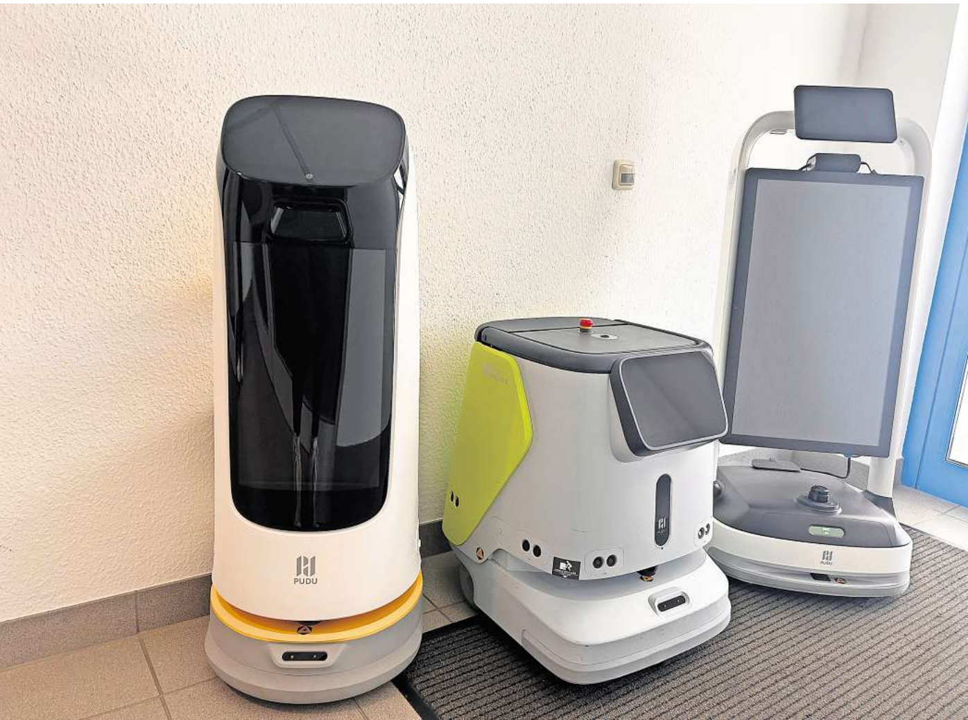
Helfen bei der Arbeit: Marketingroboter Kitty, Reinigungsroboter CC1 und Universalroboter PuduBot 2.

Das Unternehmen IT2people programmiert die wendigen Maschinen