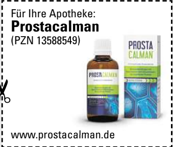
Abbildung Betroffenen nachempfunden PROSTACALMAN. Wirkstoffe: Serenoa repens, Pareira brava, Populus tremuloides Dtl. D2. Prostacalman wird angewendet entsprechend den homöopathischen Arzneimittelbildern. Dazu gehören: Blasenentzündungen und Beschwerden beim Wasserlassen, bei vergrößerter Prostata. www.prostacalman.de • Zu Risiken und Nebenwirkungen lesen Sie die Packungsbeilage und fragen Sie Ihre Ärztin, Ihren Arzt oder in Ihrer Apotheke. • PharmaSGF GmbH, 82166 Gräfelfing

Häufiger Harndrang, der Urin kommt nur noch tröpfchenweise oder die Blase fühlt sich nicht entleert an? Schuld daran ist oft die Prostata. Dieses sogenannte „Männerorgan“ kann mit zunehmendem Alter wachsen und dadurch die Harnröhre blockieren. Experten haben ein Arzneimittel namens Prostacalman entwickelt, das gleich drei Wirkstoffe in sich vereint: Serenoa repens, Pareira brava und Populus tremuloides. Diese Arzneistoffe sind dafür bekannt, u. a. den nächtlichen Harndrang zu reduzieren, den Urinfluss zu verstärken und den Restharn in der Blase zu verringern. Genial: Prostacalman beeinträchtigt nicht die Sexualfunktion. Das Arzneimittel ist rezeptfrei in jeder Apotheke erhältlich.