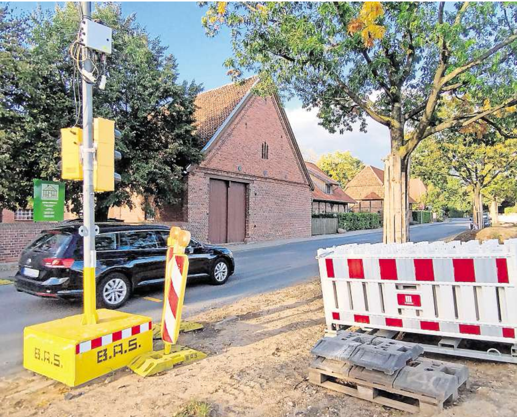
Ab dem 14. Oktober gesperrt: Die K113 in Isernhagen K.B.

Anwohner im Baustellenbereich können Grundstücke nur fußläufig erreichen