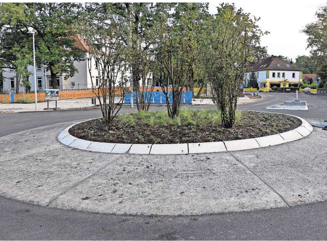
Fertig: der neue Rathaus-Kreisel.

An einigen Stellen klaffen noch Löcher in der Fuhrberger Straße, auch müssen Überwege noch fertig gepflastert, Verkehrszeichen montiert und Fahrbahnmarkierungen aufgebracht werden. Doch das Gros der Arbeiten ist planmäßig erledigt, und damit kann der Kreisel bald für den Verkehr freigegeben werden. Die Region Hannover als Bauherrin auf der Kreisstraße 117 kündigt dies für Montag, 21. Oktober, an. Das