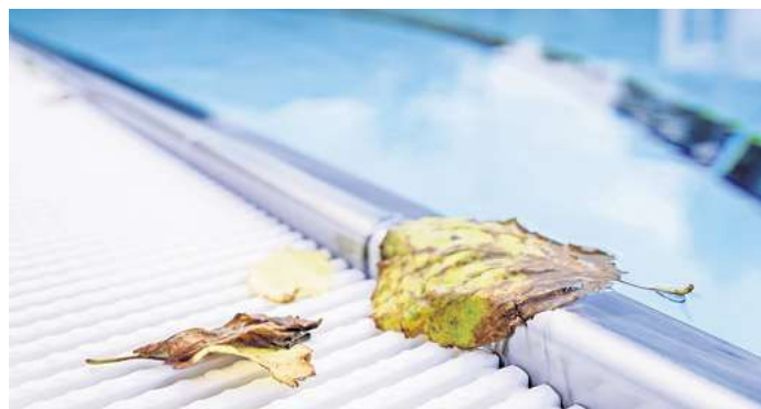
Wer einen Pool unter Nachbars Eichen baut, kann keine Entschädigung für den Laubfall verlangen.