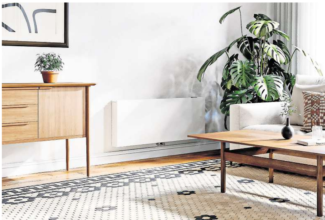
Zeitgemäß und klimaschonend heizen und dabei vollen Komfort genießen? Kein Problem! Mit einem kompakten Wärmepumpenheizkörper für eine niedrige Wassertemperatur.

Wer auf Niedrigtemperaturheizkörper setzt, kann sich dank einer innovativen Lösung den befürchteten Kompletttausch seiner bisherigen Heizlösung sparen. Experten haben schon längst Heizkörper entwickelt, die nicht nur mit weniger Energie behagliche Wärme garantieren, sondern an heißen Sommertagen sogar Räume herunterkühlen können und so zusätzlichen Komfort bieten. Daher spricht man nicht von Heiz-, sondern von Klimakörpern. Bei niedrigen Systemtemperaturen haben die Wärmepumpenheizkörper eine um ein Vielfaches höhere Leistung als konven-