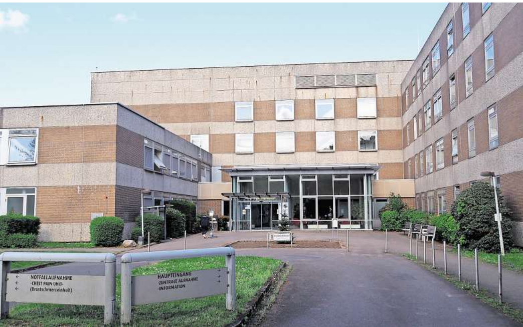
Neue Untersuchungsmöglichkeit: Am Krankenhaus Großburgwedel soll es künftig ein MRT geben.

Der Gesundheitsausschuss der Region hat diesen Schritt bereits einhellig empfohlen, die endgültige Entscheidung trifft die Regionsversammlung in ihrer Sitzung am Dienstag, 12. November. Die 3 Millionen Euro sind nicht allein für das medizinische Gerät veranschlagt, son-