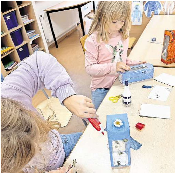
Die Kinder hatten unter anderem die Möglichkeit, Deko-Laternen, Vogelhäuschen und Traumfänger zu basteln.

Das Schrottorchester sorgte für musikalische Unterhaltung und bewies eindrucksvoll, dass man mit ausgedienten Materialien wunderbare Klänge erzeugen kann. Die Kinder der 3. Klassen sangen ein Lied, in dem sie den „Großen“ mal klarmachten, dass nicht nur die Kinder, sondern auch die Erwachsenen