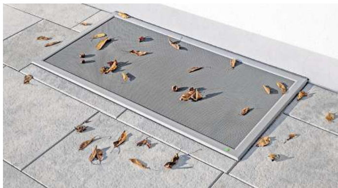
Mit Lichtschachtabdeckungen haben Laub, Dreck und Kleintiere keine Chance, in die Kellerräume zu gelangen – frische Luft ist dagegen nach wie vor herzlich willkommen. Unterschiedliche, hochwertige Modelle sorgen dafür, dass es für jeden Anspruch die passende Variante gibt.

Das Sortiment von Experten beinhaltet mit einem wasserresistenten, einem flächenbündigen eleganten und einem für Holterrassen geeigneten Modell weitere hochwertige Ausführungen, sodass sich für jeden