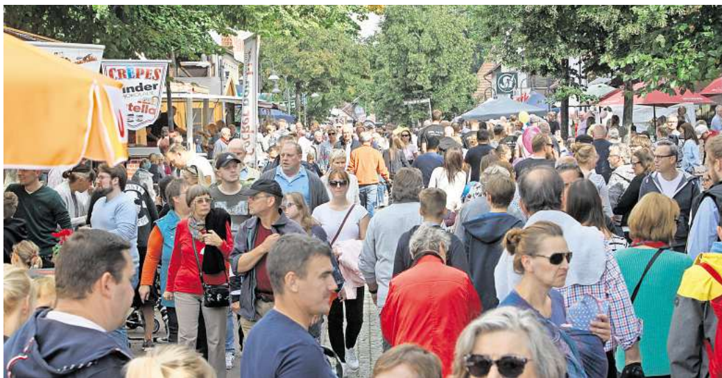
Stets Besuchermagnete, trotzdem Defizit: Die IGK wird keine Stadtfeste mehr organisieren.

Die IGK stand damit vor einer Grundsatzentscheidung, wie es mit den Festen weitergehen kann. Müller favorisiert ein Konstrukt, wie es beispielsweise in Burgdorf besteht: Ein Stadtmar-