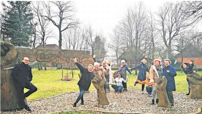
Der Chor Encanto verspricht einen musikalischen Abend, der Herzen berührt und begeistert.

FUHRBERG (r/bs). Der Chor Encanto lädt am Sonnabend, 9. November, um 17 Uhr zu einem stimmungsvollen Konzert mit Klavierbegleitung in das ev. Gemeindehaus Fuhrberg, in den Tweechten 8, ein. Die Besucher können sich auf einen abwechslungsreichen Mix aus mitreißenden Musical-Hits, modernen Pop-Songs und traditionellen Melodien freuen. Ein musikalisches Programm voller Wärme und Farben, abgerundet durch eine gemütliche Pause mit Getränken. Der Eintritt zum Konzert ist frei, Spenden sind willkommen.