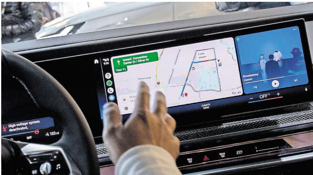
Welcher Weg zur Arbeit ist der kürzeste? Denn das ist in der Regel der, den Beschäftigte steuerlich geltend machen können.