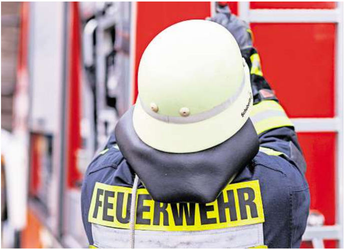
Übernehmen Sie als Ausbilder Verantwortung in der freiwilligen Feuerwehr? Dann belohnt der Fiskus Ihr Engagement unter Umständen mit Steuerentlastungen.

Bedingung ist: Die Tätigkeit muss gemeinnützigen, mildtätigen oder kirchlichen Zwecken dienen oder im öffentlichen Auftrag erfolgen. Und sie darf nur nebenberuflich mit einem zeitlichen Umfang von maximal einem Drittel der Hauptbeschäftigung ausgeübt werden. Gerade letztere Bedingung kann für geringfügig Beschäftigte zur Herausforderung werden, wenn in der hauptberuflichen Tätigkeit nur wenige Arbeitsstunden zusammenkommen. Ausgeschlossen sei die Kombination aus einem Minijob und der Inanspruchnahme der Pauschalen