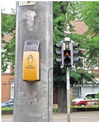
Bleibt stumm: Die Fußgängerampel an der Grundschule gibt bislang noch keinen Ton von sich, was für seheingeschränkte Menschen gefährlich ist.

möglichst noch 2024 verbessert werden sollen. Die Einmündungen der Pestalozzistraße und des Alten Postwegs auf die Hannoversche Straße sollen so umgestaltet werden, dass Fußgängerinnen und Fußgänger diese Bereiche sicherer queren können. An der Pestalozzistraße fehlen taktile Elemente für seheingeschränkte Menschen, am Alten Postweg soll zudem der Fußweg entlang der Hauptstraße durch gepflastert und mit einem weiteren Rundbord versehen werden. So will die Stadt die Aufmerksamkeit von Autofahrenden aus der Seitenstraße stärker