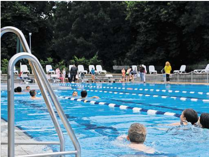
Aktion Rettungsring im Freibad Großburgwedel: 60 Schülerinnen und Schüler machen das Seepferdchen, Bronze oder Silber.