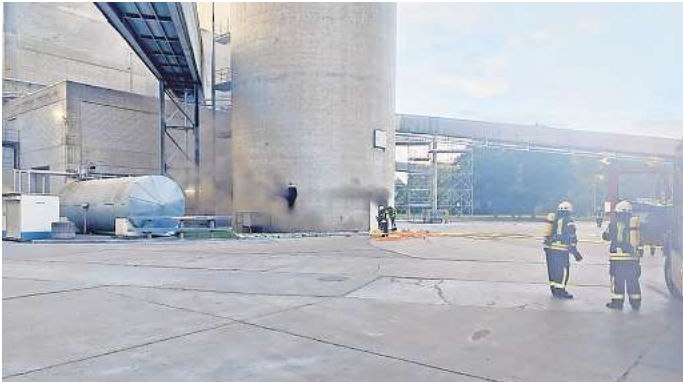
Feuerwehr-Einsatz in Höver am 12. Juni.

wurde eine Wasserversorgung aufgebaut. Durch das schnelle Eingreifen der Feuerwehr konnte das weitere Ausbreiten des Feuers auf das Silo verhindert werden. Im Anschluss wurde mit Hilfe von einem Hochdrucklüfter das Silo, sowie der Betriebsraum des Förderluftgebläse belüftet, so der Bericht von Feuerwehr-Sprecher Fabian Flodman.