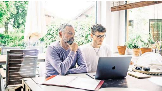
Ratlos bei der Steuererklärung? Zumindest die Angabe zur Dezember-Soforthilfe können Sie sich sparen.

Weil die Bundesregierung den damit verbundenen Verwaltungsaufwand aber als zu hoch einschätzte, wurde die nachträgliche Besteuerung der Preisbremsen im Dezember 2023 gänzlich aufgehoben – da standen die Formulare allerdings schon. «Deshalb muss die Abfrage in Zeile 17 der Anlage SO zur Einkommensteuererklärung 2023 nicht ausgefüllt werden», sagt Karbe-Geßler. Einen entsprechenden Hinweis bekommen Steuerzahlerinnen und Steuerzahler auch, wenn sie das entsprechende Formular online aufrufen. DPA