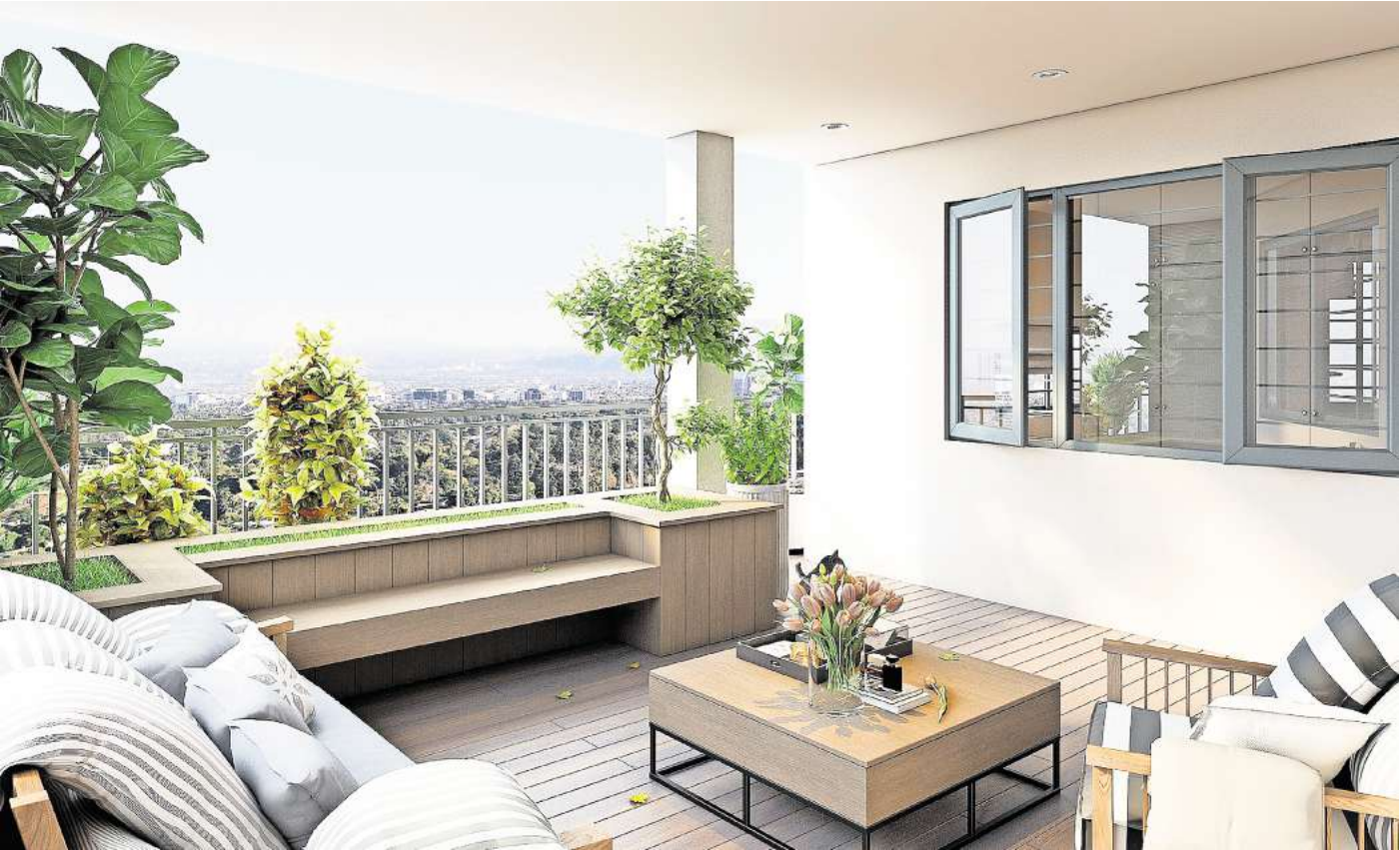
Möbel auf Maß sparen Platz und sehen perfekt integriert aus.

Balkone und Terrassen weisen einen begrenzten Platz auf und sollen einladend und gemütlich wirken. Insbesondere große Familien benötigen zudem ausreichend Platz, um entspannt zusammensitzen zu können. Balkon- und Terrassenmöbel gibt es in Hülle und Fülle, aber nicht jeder Grundriss ist für Fertigmöbel geeignet. Besonders Balkone müssen manchmal mit etwas Raffinesse eingerichtet werden, damit jeder Platz genutzt werden kann. Eine attraktive Alternative zu Fertigmöbeln sind Möbel auf Maß. Egal ob Tische, Stühle, Gartenmöbel, Sitzgruppen, Hocker, Rund-, Garten- oder Eckbänke: Jedes Möbelstück lässt sich auf Maß anfertigen. Auf diese Weise erhält man platzsparendes, hochwertiges und zeitloses Mobiliar für seinen