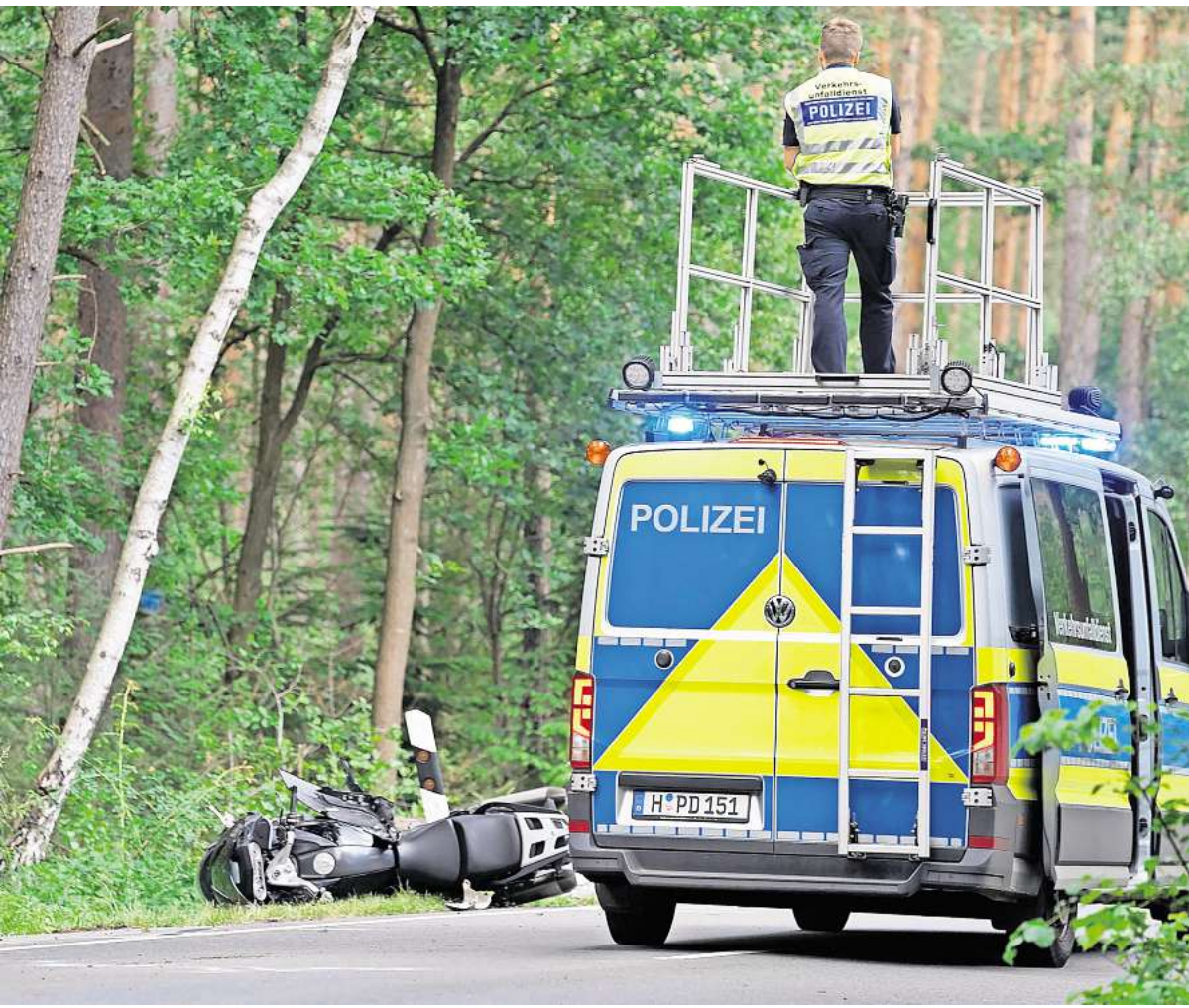
Endete tragisch: Der Zusammenstoß eines Motorradfahrers mit einem Auto zwischen Gailhof (Wedemark) und Fuhrberg (Burgwedel).

Während in den zwei Kurvenbereichen auf der L310 Tempo 70 gilt, verläuft der größte Teil der Strecke mit 1,5 Kilometern sehr gerade – dort gilt Tempo