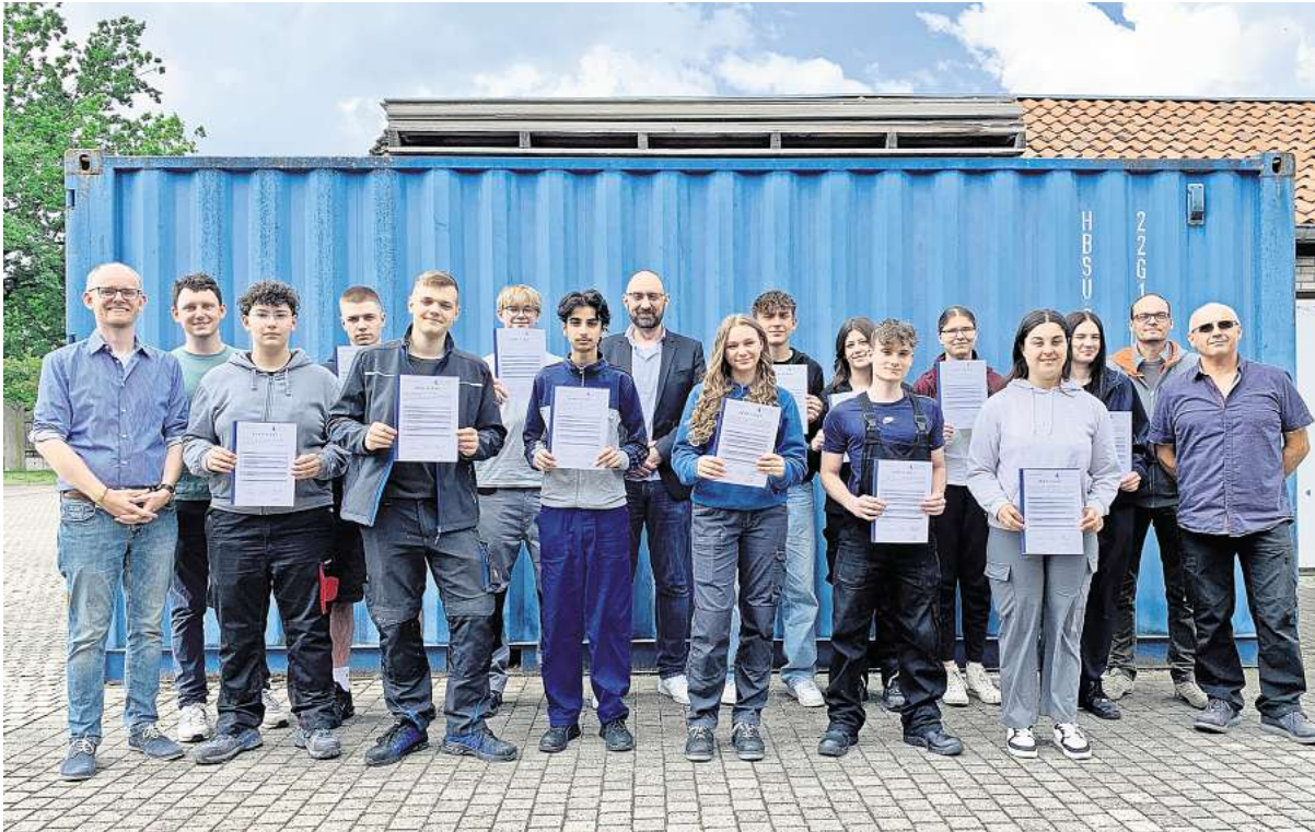
Die Teilnehmer freuen sich gemeinsam mit ihren Betreuern über ihre Zertifikate und die gesammelten Erfahrungen.