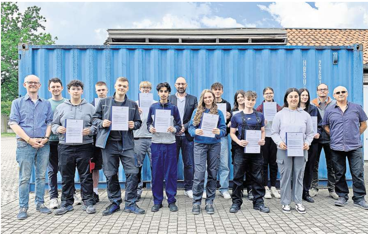
Die Teilnehmer freuen sich gemeinsam mit ihren Betreuern über ihre Zertifikate und die gesammelten Erfahrungen.