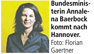
Bundesministerin Annalena Baerbock kommt nach Hannover.

einem eigenen, kostenlosen Insekten-Sonderquiz. Mit einer eigenen TV-Show in Deutschland und über 100 Millionen Downloads ist Quizduell das führende mobile Trivia-Game in Europa. Der Insektensommer ist eine Gemeinschaftsaktion von NABU und LBV. Die Daten der Zählaktion werden in Zusammenarbeit mit der Meldeplattform www.NABU-naturgucker.de erfasst. Die Ergebnisse werden vom NABU transparent und zeitnah auf www.NABU.de/Insektensommer-Ergebnisse veröffentlicht. Die Aktion ist die größte Insektenzählaktion in Deutschland. Mehr Infos zur Aktion finden Interessierte unter www.insektensommer.de .