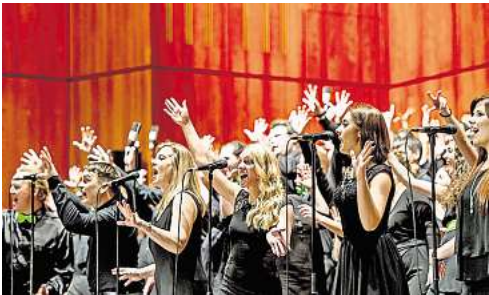
Anmeldung unter: www.sing-out-projekt.de

dann mit den Zuschauern die Musik feiern. Für eine Anmeldegebühr erhalten die Sänger die Teilnahme an Workshops, sechs Monate Proben mit Vocalcoaches und Übungsmaterialien und den großen Auftritt in der Swiss Life Hall.