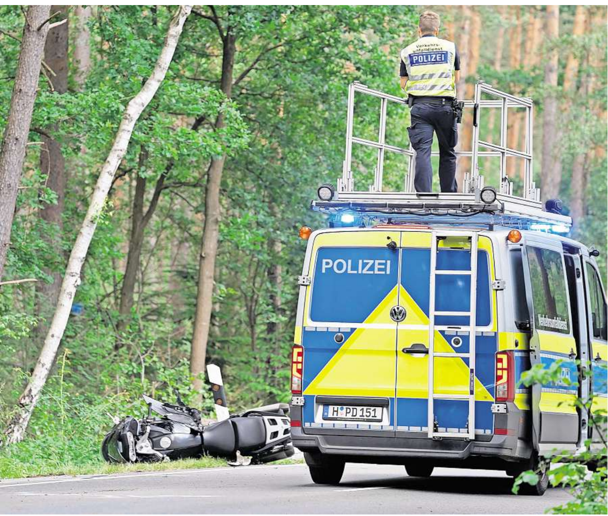
Endete tragisch: Der Zusammenstoß eines Motorradfahrers mit einem Auto zwischen Gailhof (Wedemark) und Fuhrberg (Burgwedel).

Während in den zwei Kurvenbereichen auf der L310 Tempo 70 gilt, verläuft der größte Teil der Strecke mit 1,5 Kilometern sehr gerade – dort gilt Tempo