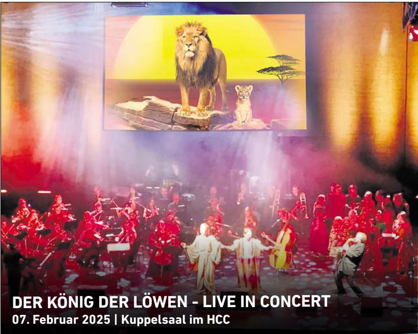
DER KÖNIG DER LÖWEN - LIVE IN CONCERT 07. Februar 2025 | Kuppelsaal im HCC