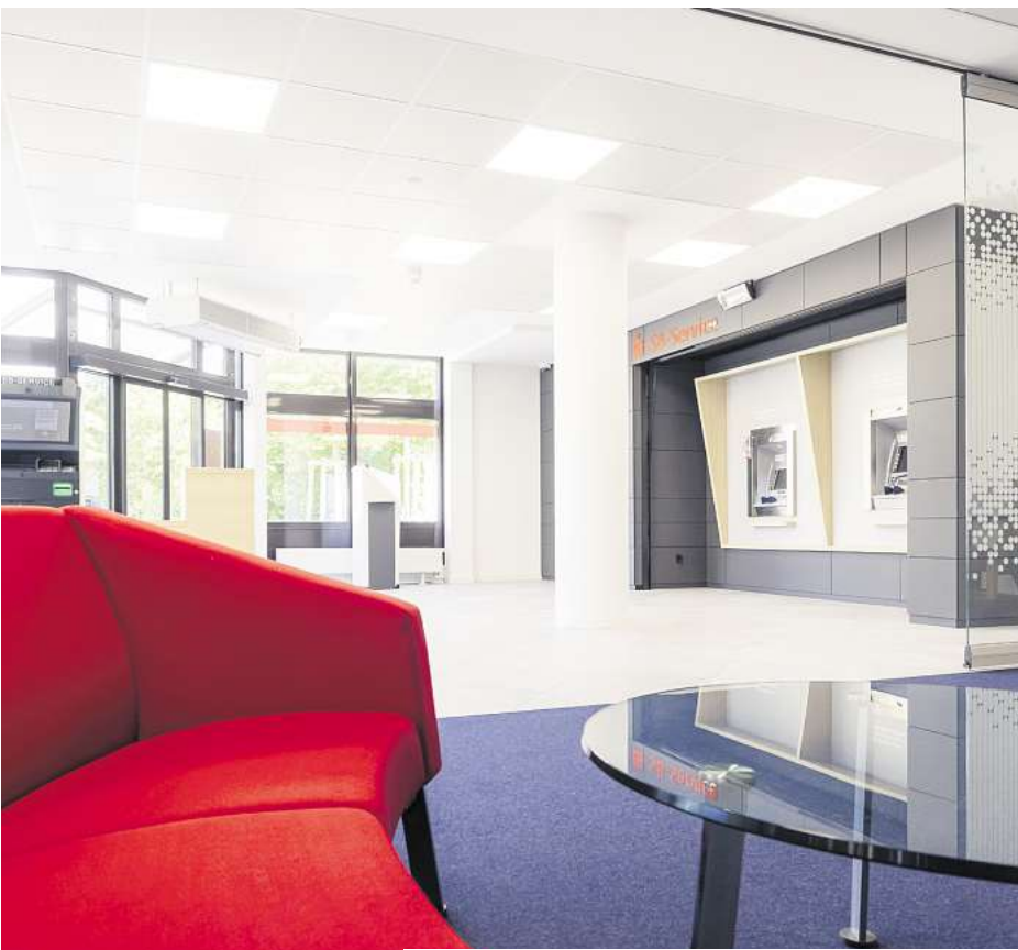
Der neue eröffnete SB-Bereich des BeratungsCenters Altwarmbüchen (oben) und nach der Sprengung durch unbekannte Täter im Mai 2022 (rechts).

„Das Team freut sich, zurück in Altwarmbüchen zu sein und unsere Leistungen wieder ohne