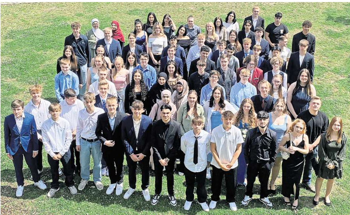
Abschied von der IGS Isernhagen: Rund 70 Schülerinnen und Schüler verlassen nach der zehnten Klasse die Schule.

Die Quote der Absolventen 2024 kann sich dennoch sehen lassen. „Ihr seid ein kleiner, aber leistungsstarker Jahrgang“, be-