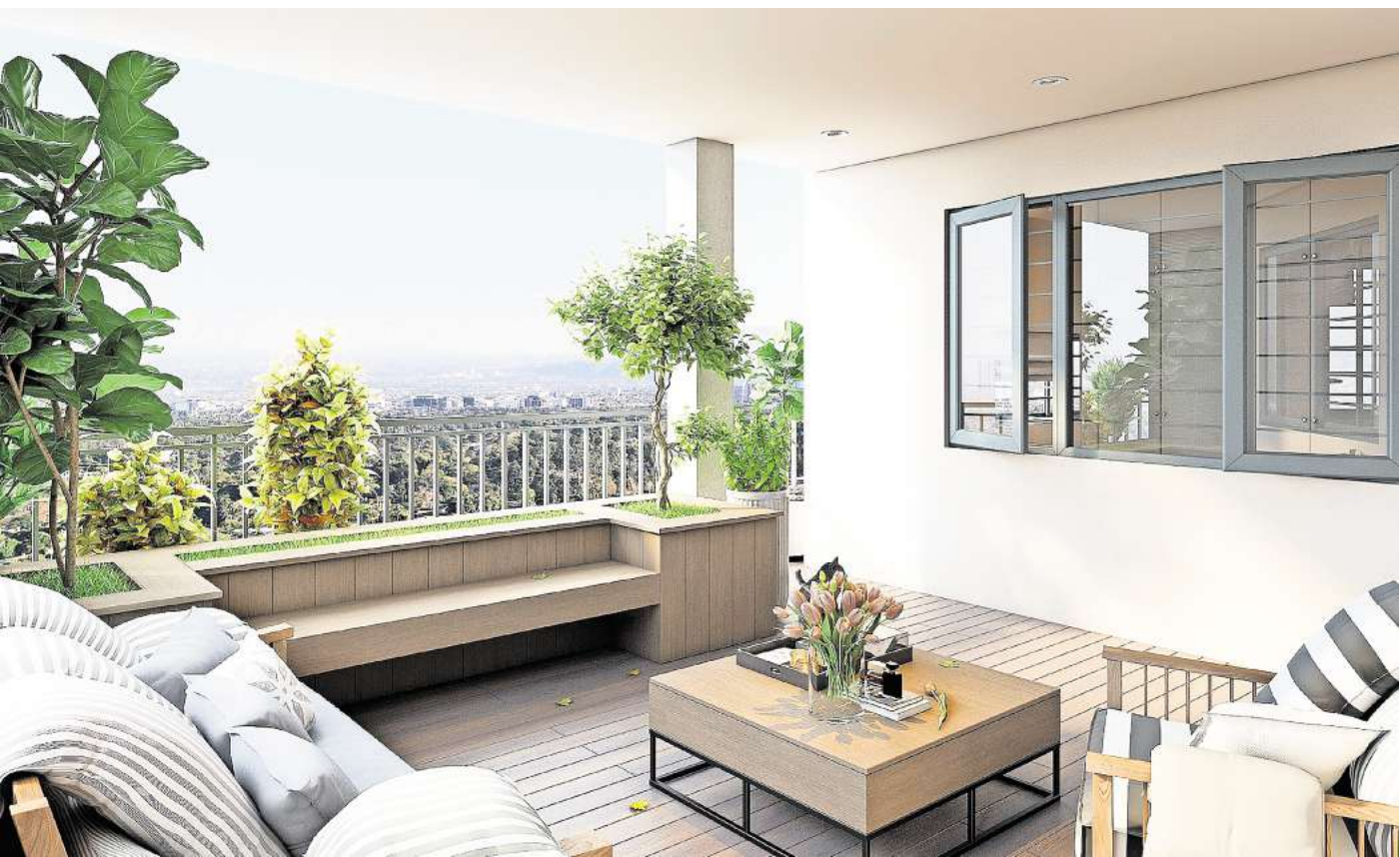
Möbel auf Maß sparen Platz und sehen perfekt integriert aus.

Balkone und Terrassen weisen einen begrenzten Platz auf und sollen einladend und gemütlich wirken. Insbesondere große Familien benötigen zudem ausreichend Platz, um entspannt zusammensitzen zu können. Balkon- und Terrassenmöbel gibt es in Hülle und Fülle, aber nicht jeder Grundriss ist für Fertigmöbel geeignet. Besonders Balkone müssen manchmal mit etwas Raffinesse eingerichtet werden, damit jeder Platz genutzt werden kann. Eine attraktive Alternative zu Fertigmöbeln sind Möbel auf Maß. Egal ob Tische, Stühle, Gartenmöbel, Sitzgruppen, Hocker, Rund-, Garten- oder Eckbänke: Jedes Möbelstück lässt sich auf Maß anfertigen. Auf diese Weise erhält man platzsparendes, hochwertiges und zeitloses Mobiliar für seinen