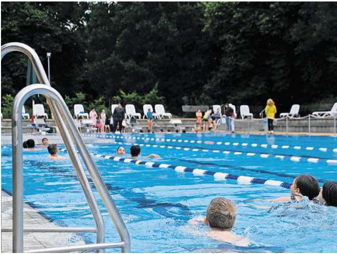
Aktion Rettungsring im Freibad Großburgwedel: 60 Schülerinnen und Schüler machen das Seepferdchen, Bronze oder Silber.