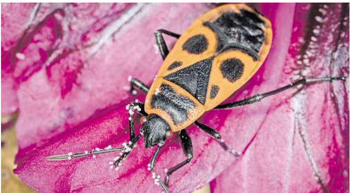
Der NABU-Insektensommer nimmt in diesem Jahr die Feuerwanze genauer unter die Lupe.

und dem Asiatischen Marienkäfer auf Platz drei. „Für den zweiten Zählzeitraum im August hoffen wir auf besseres Wetter. Bei Dauerregen und kühlen Temperaturen, wie es in Niedersachsen zuletzt der Fall war, fliegen auch Insekten nicht gern, sondern sitzen still oder verstecken sich. Bei windstillem und sonnigem Wetter hingegen tummeln sie sich gern und lassen sich auch an ungewöhnlichen Orten beobachten und zählen, wie am Badesee oder beim Warten auf den Bus.“ Vom 2. bis 11. August sind alle großen und kleinen Insektenfans erneut aufgerufen, bis zu einer Stunde draußen in der Natur zu verbringen und sich zu notieren, wie viele Feuerwanzen