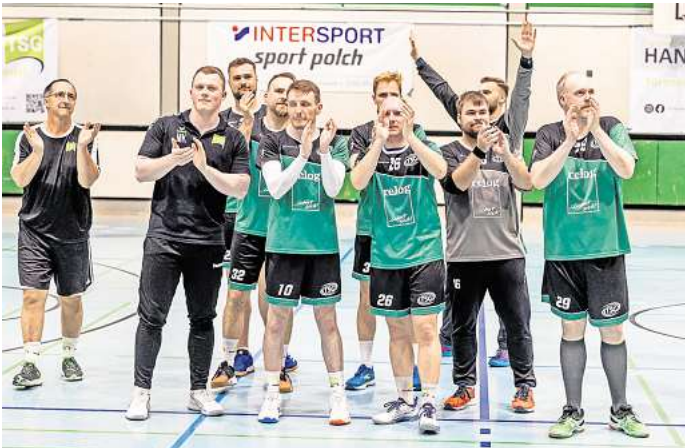
Die Akteure bedankten sich nach dem letzten Turnierspiel bei den vielen Besuchern in der Halle.