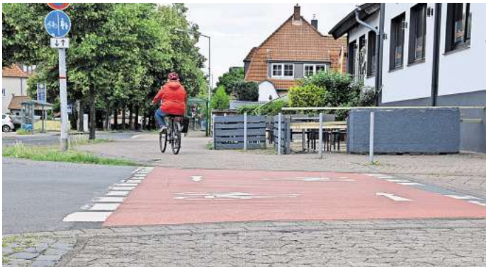
Taktile Elemente fehlen: der Einmündungsbereich Pestalozzistraße/Hannoversche Straße.

Ein Aha-Erlebnis hatte die Gruppe auch vor der Grund-