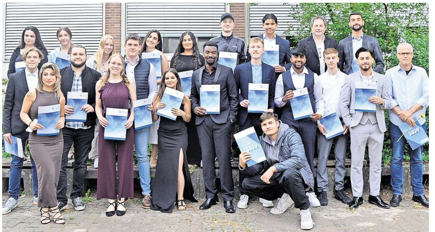
Die erfolgreichen Absolventen der Fachoberschulen Technik und Wirtschaft der BBS Burgdorf.

Als Beispiel ging er auf die Europawahl und die daraus resultierenden Herausforderungen und Bedrohungen ein und betonte die Bedeutung eines jeden Einzelnen, sich für Toleranz, Vielfalt und Internationalität einzusetzen. „Mit diesem Schulabschluss stehen Ihnen viele We-